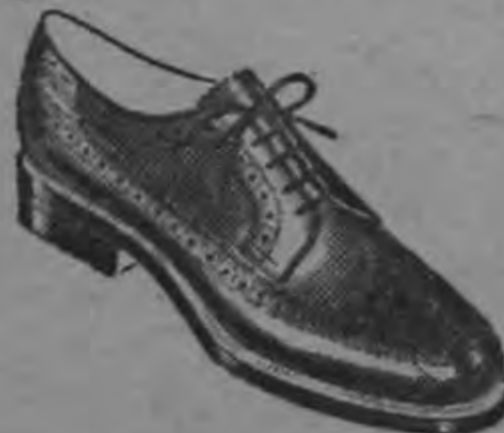
Para escolares $ 20.00