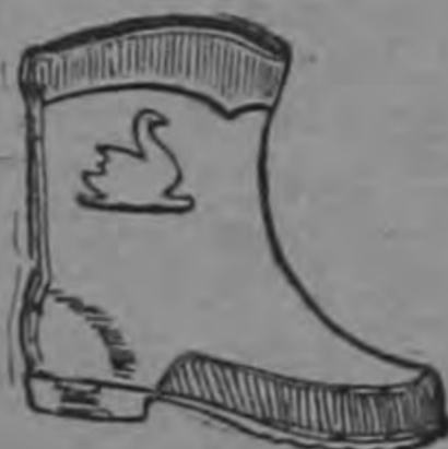
PATITO $ 10.00