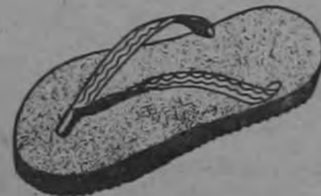
Playeras para señoras $ 11.00